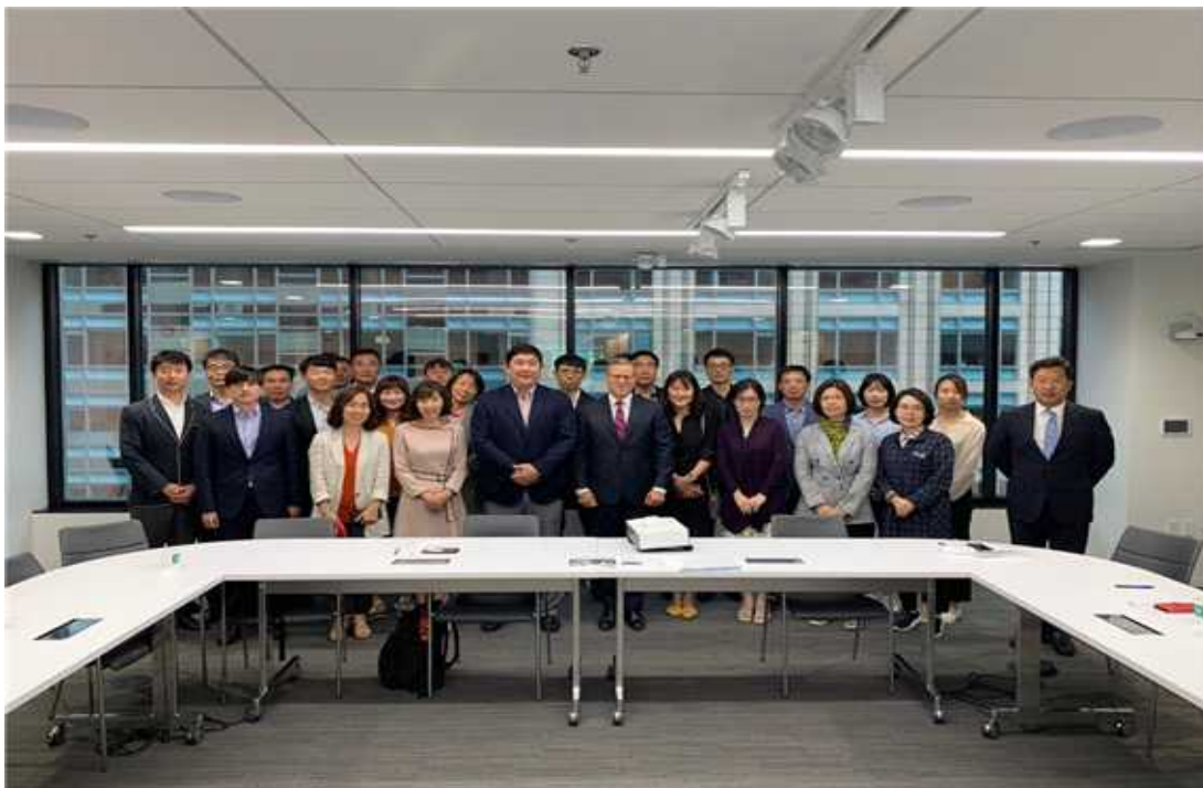
허드슨 연구소 방문 사진