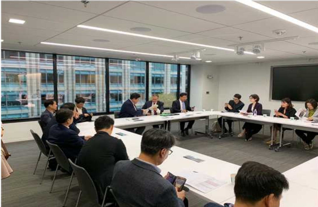
허드슨 연구소 회의 사진