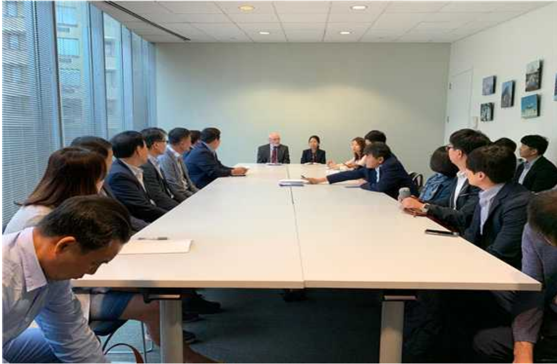
패터슨 국제경제연구소 회의 사진