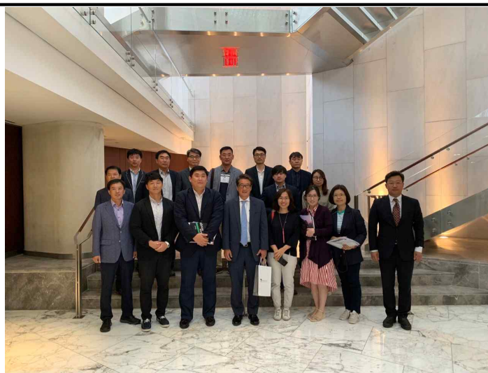
<전략국제문제연구소 단체 사진>