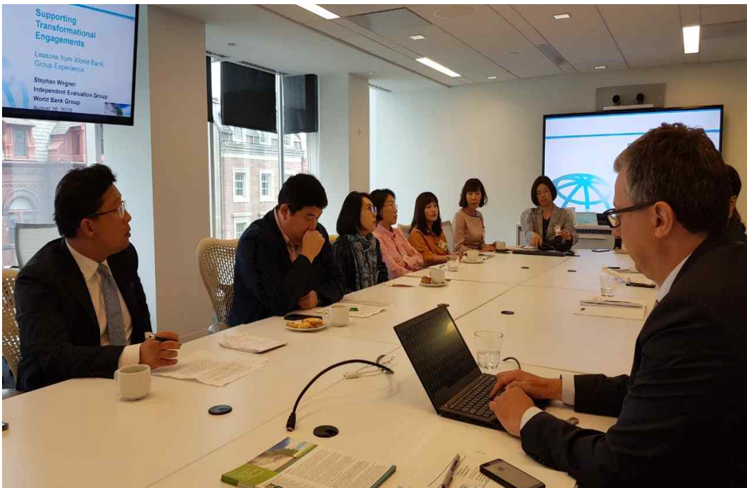
세계은행 회의 사진