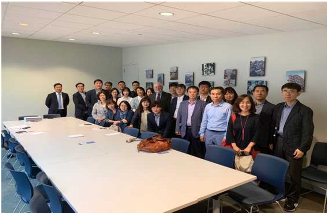
패터슨 국제경제연구소 방문 사진