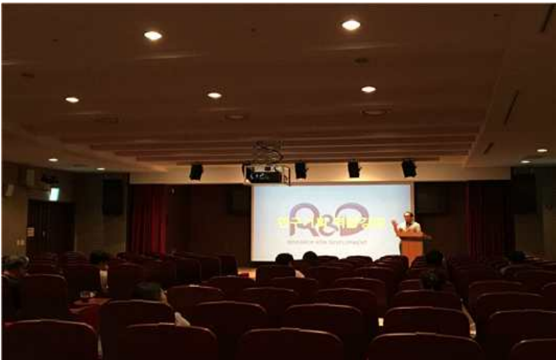
2회차 지상철 교수 강의 사진