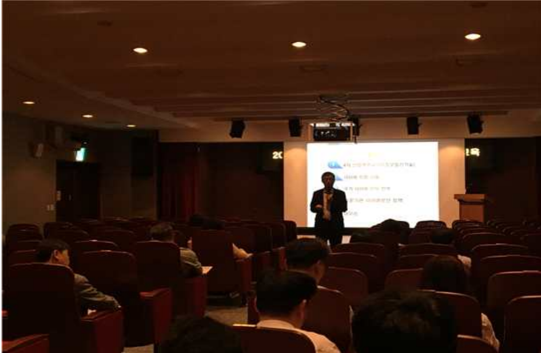
3회차 한근희 교수 강의 사진