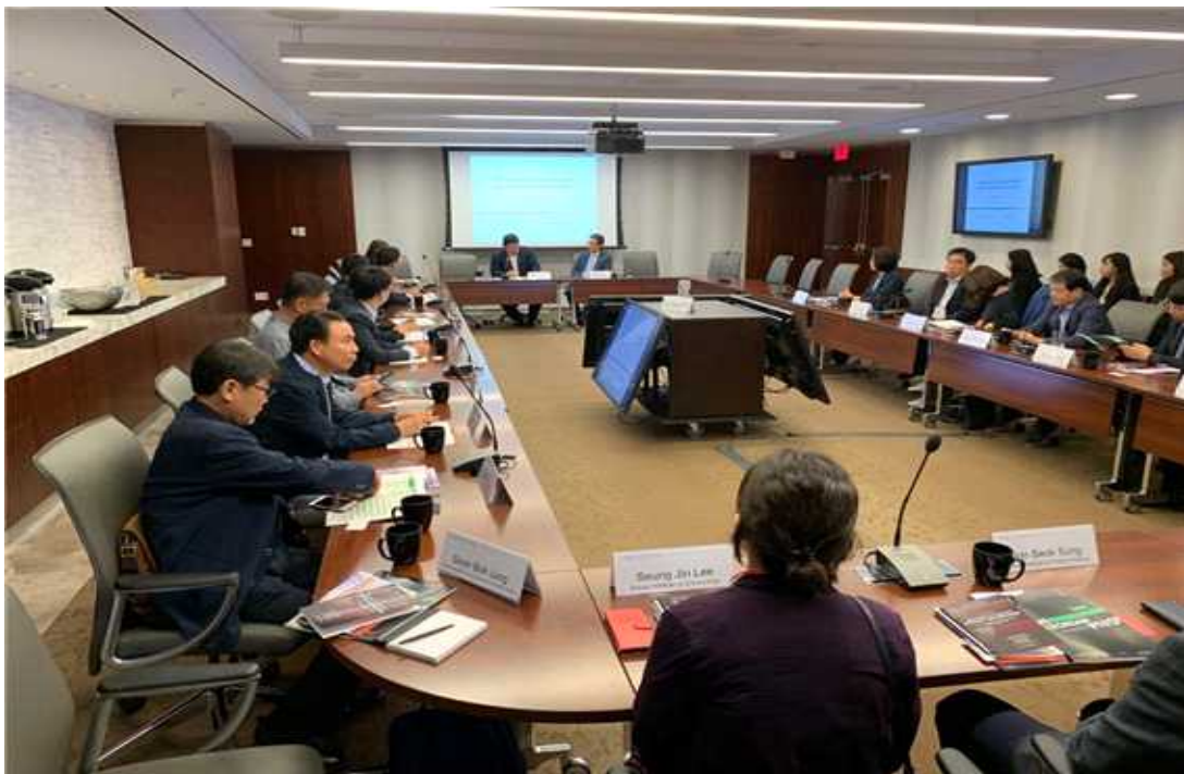
전략국제문제연구소 회의 사진