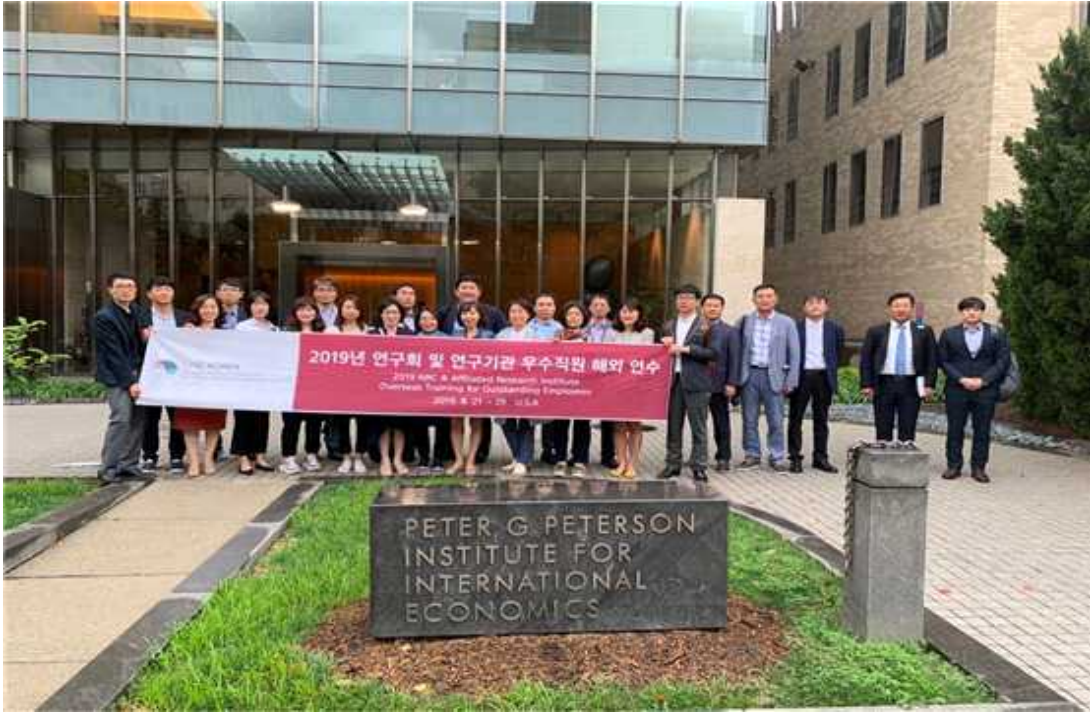
패터슨 국제경제연구소 방문 사진