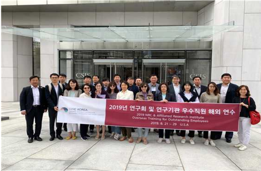
전략국제문제연구소 방문 사진