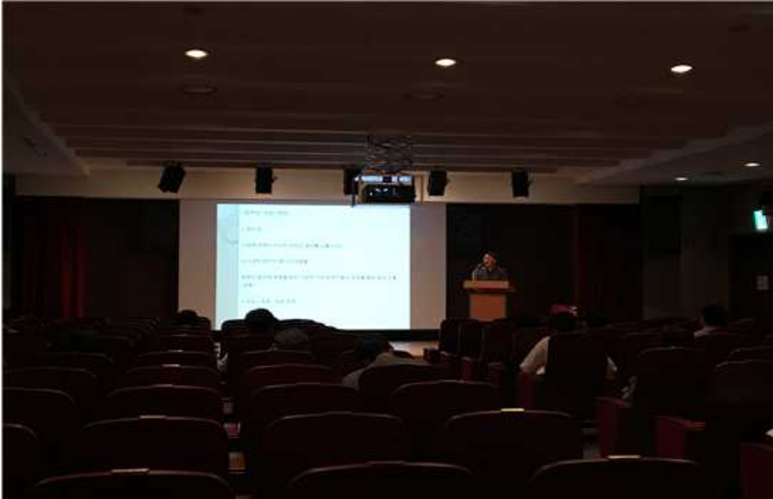
1회차 정진호 세종평생교육원장 강의 사진