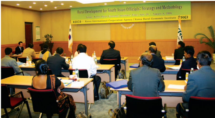
서남아시아 4개국 공무원들을 대상으로 7월 20일부터 농촌개발 연수를 실시하고 있다.

우리 연구원은 한국국제협력단(KOICA)과 공동으로 서남아시아 4개국 공무원들을 대상으로 농촌개발 연수를 지난 7월 20일에 시작해 8월 4일까지 진행한다.