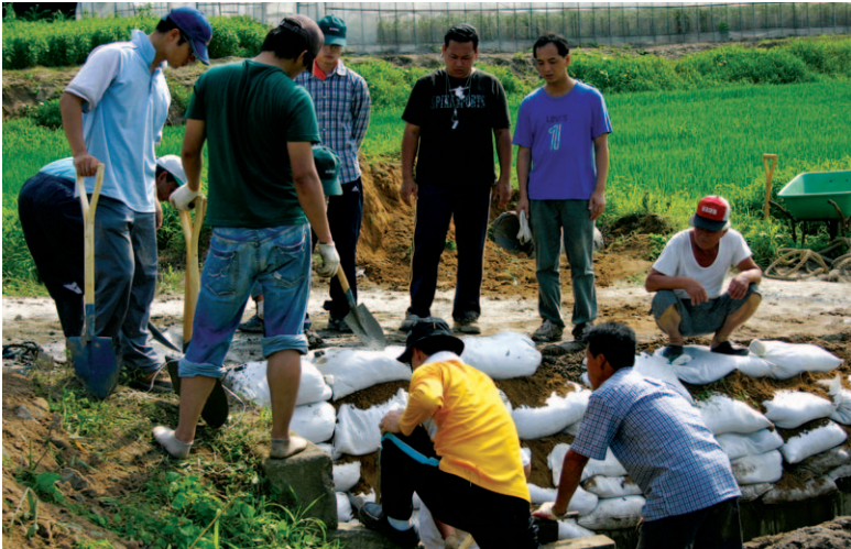
우리 연구원은 지난 폭우로 피해를 입은 횡성군을 찾아가 용수로 복구사업을 도왔다.