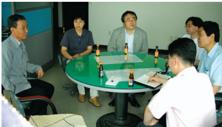
자료정보지원실은 천안 농업기술센터를 방문하여 간담회를 가졌다.

우리 연구원은 올해 현장연구 강화와 고객의 연구수요파악을 위해 현장연수를 실시하고 있다.