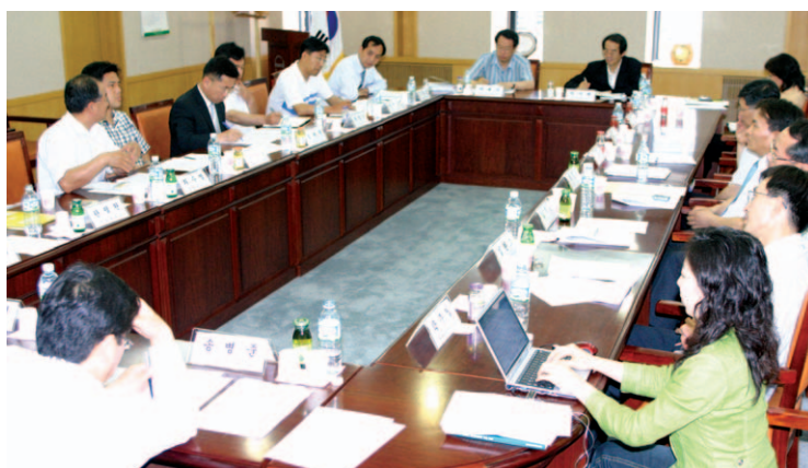
'농촌공간 2020-농촌의 미래 모습' 전문가 워크숍을 7월 5일 연구원에서 가졌다.

우리 연구원은 7월 5일 중회의실에서 '농촌공간 2020-농촌의 미래 모습'이란 주제로 전문가 워크숍을 열었다.