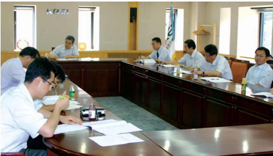
부서별로 연구의 내실을 기하고자 기본과제를 중심으로 중간검토회의를 가졌다.

연구의 내실화를 위해 연구원은 6월 말부터 중간검토회의를 시작하여 7월 중순에 모두 마쳤다.