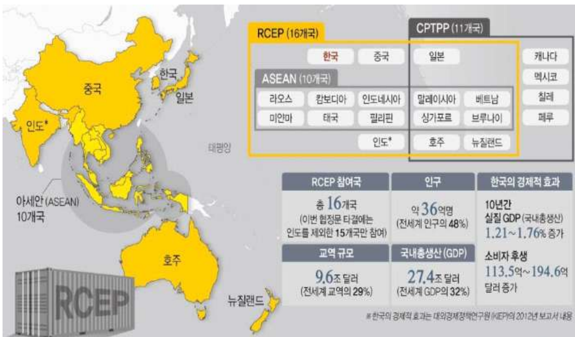
<그림 2> 역내포괄적경제동반자협정(RCEP) 개요

RCEP가 체결됨으로써 역내 인구 34억 명, 무역규모 10조 1310억 달러(약 1경 1043조 원), 명목 국내총생산(GDP) 19조 7,640만 달러에 이르는 자유무역지대가 성립하였다. 이로써 명목GDP 기준으로 북미자유무역협정(NAFTA, 18조 달러)과 유럽연합(EU, 17조 6000억 달러)을 능가하는 세계 최대의 경제블록이 출범한 셈이다.