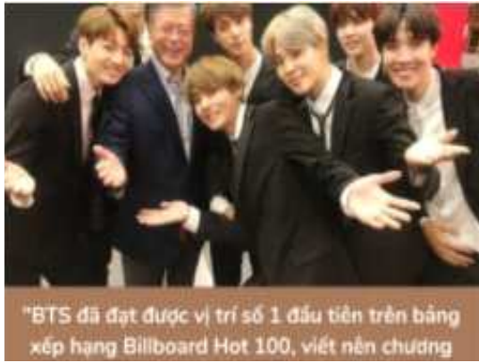
<그림 3> 베트남의 한류 문화 모습